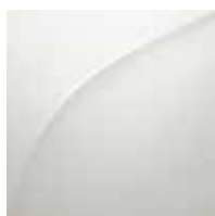
Blanc neige nacré (N)